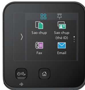
Bảng điều khiển cảm ứng màu 2.8-inch